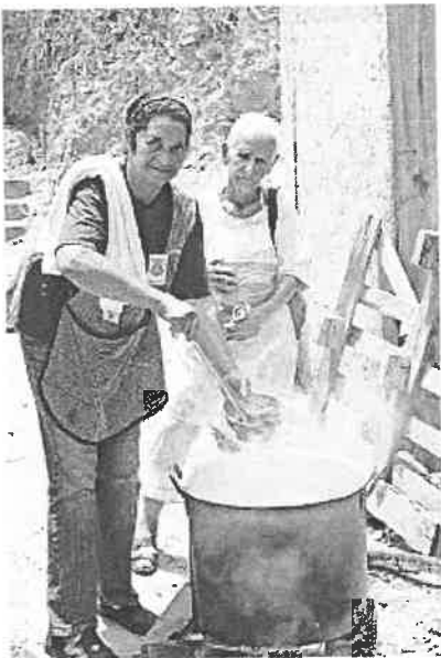
Eine Frau in einer Pfarrei kocht in einer grossen Pfanne für die Bedürftigen, Venezuela

«Kirche in Not (ACN)» ist ein internationales katholisches Hilfswerk päpstlichen Rechts, das 1947 von Pater Werenfried van Straaten (Speckpater) als „Ostpriesterhilfe“ gegründet wurde. Es steht mit Hilfsaktionen, Informationstätigkeit und Gebet für bedrängte und Not leidende Christen in ca. 150 Ländern ein. Seine Projekte sind ausschliesslich privat finanziert. Das Hilfswerk wird von der Schweizer Bischofskonferenz für Spenden empfohlen.