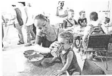
Menschen erhalten in einer Pfarrei eine warme Mahlzeit, Venezuela

*Ivo Schürmann arbeitet als Referent für Öffentlichkeitsarbeit bei «Kirche in Not (ACN)» und bereiste anlässlich einer Projektreise verschiedene Städte im Venezuela, um sich einen Überblick über die Lage vor Ort zu verschaffen.