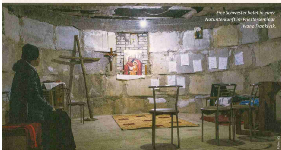
Eine Schwester betet in einer Notunterkunft im Priesterseminar Ivano Frankivsk.