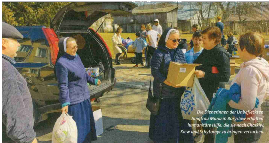
Die Dienerinnen der Unbefleckten Jungfrau Maria in Boryslaw erhalten humanitäre Hilfe, die sie nach Charkiw, Kiew und Schytomyr zu bringen versuchen.