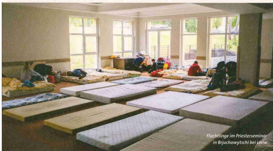
Flüchtlinge im Priesterseminar in Brjuchowytschi bei Lwiw.