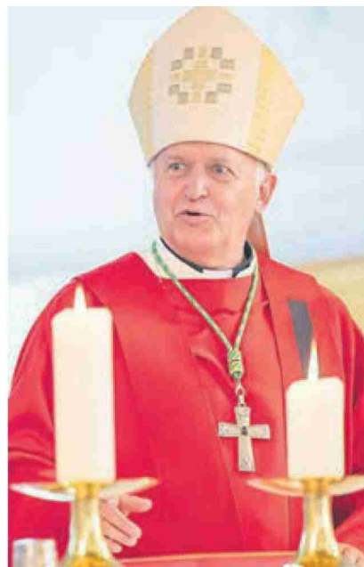
Bischof Ladislav Nemet führte die Firmung durch.

ausgezeichnete Vorbereitungsarbeit. Die Kollekte wurde eingezogen für die kleine, nicht begüterte Gemeinschaft der Katholiken in Serbien, Nordmazedonien, Montenegro und Kosovo für karitative und soziale Aufgaben, denen sich die katholische Kirche in diesen Ländern als Minorität mit Engagement stellt. --tre