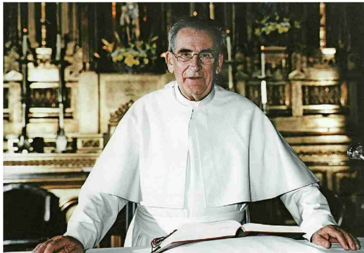
Pater Werenfried van Straaten 1992 In Spanien.